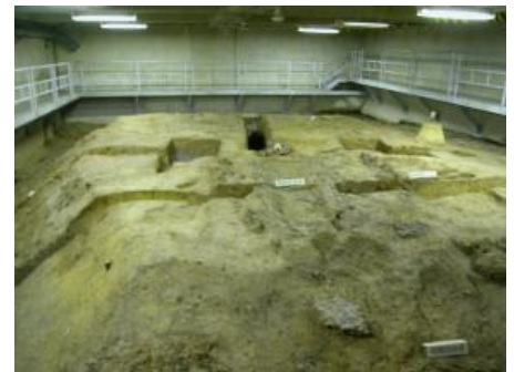
地下に旧状のまま残された製鉄炉