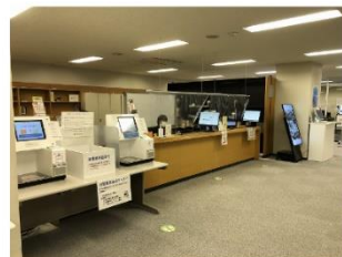
図書館カウンター

ゲート正面のサービスカウンターでは予約本の受取やノートパソコン（館内利用専用）の貸出などの各種手続きを行えます。左側のレファレンスカウンターでは利用相談や資料を探すお手伝いをします。