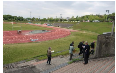
このグラウンドの下にあります